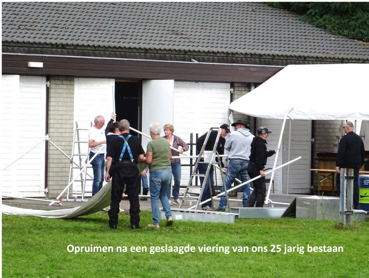
Opruimen na een geslaagde viering van ons 25 jarig bestaan

Trefpunt: Manege Blijenberg, 's-Gravelandseweg 2a, 1381 HH Weesp, aanvang: 13:00 uur.