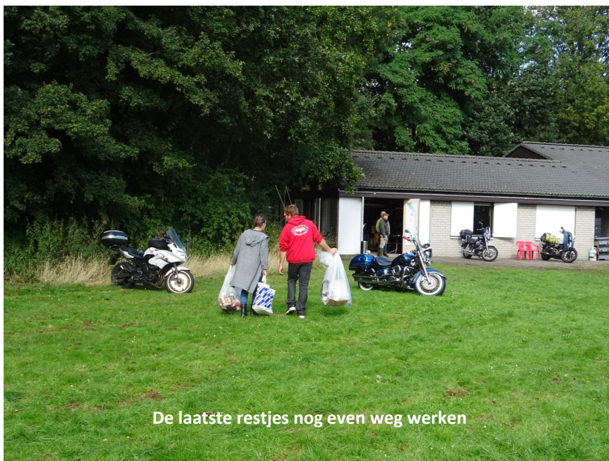
De laatste restjes nog even weg werken